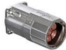
Polbild Ansicht steckseitig