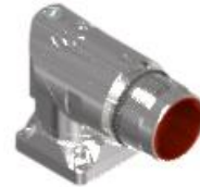
Polbild Ansicht steckseitig