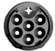
Kontaktstift ø1,0 mm crimp/ 0,14 - 1,00 mm 2 Artikel: 61.004.11