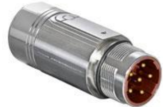
Polbild Ansicht steckseitig