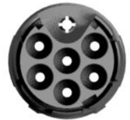
Kontaktstift ø1,0 mm crimp/ 0,14 - 1,00 mm 2 Artikel: 61.004.11