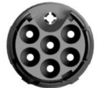
Kontaktstift ø1,0 mm crimp/ 0,14 - 1,00 mm 2 Artikel: 61.004.11