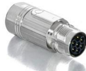
Polbild Ansicht steckseitig