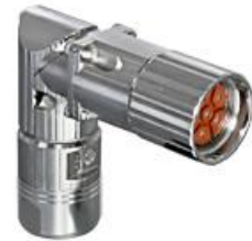
Polbild Ansicht steckseitig