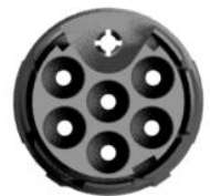
Kontaktstift ø1,0 mm crimp/ 0,14 - 1,00 mm 2 Artikel: 61.004.11