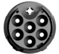
Kontaktstift ø1,0 mm crimp/ 0,14 - 1,00 mm 2 Artikel: 61.004.11