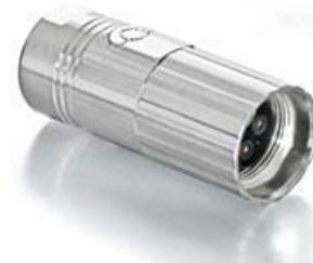
Polbild Ansicht steckseitig