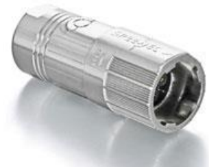
Polbild Ansicht steckseitig