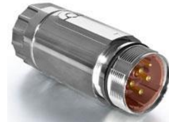
Polbild Ansicht steckseitig