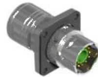
Polbild Ansicht steckseitig