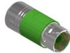
Polbild Ansicht steckseitig