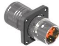
Polbild Ansicht steckseitig