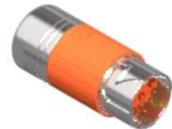
Polbild Ansicht steckseitig