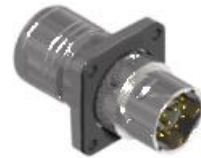
Polbild Ansicht steckseitig