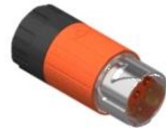
Polbild Ansicht steckseitig