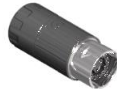
Polbild Ansicht steckseitig