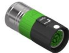
Polbild Ansicht steckseitig