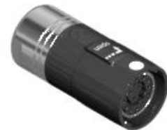
Polbild Ansicht steckseitig