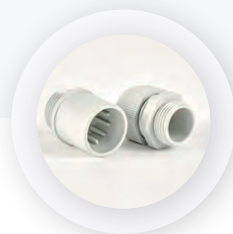
Kabelverschraubung und Wellrohradapter