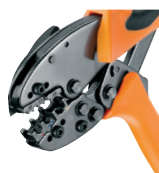
Crimpit IT 6 S