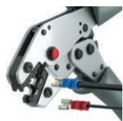
Crimpit IT 2,5 L

For processing terminals and connectors (details p. 115):